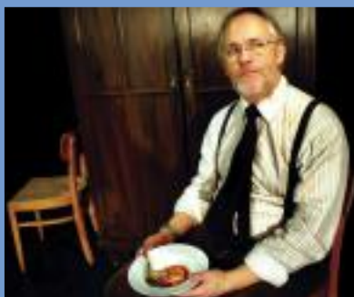
stille hunde Holzminden