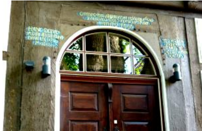
Portal der Eingangstür zum von Pastor Berckelmann 1696 erbauten Pfarrhauses