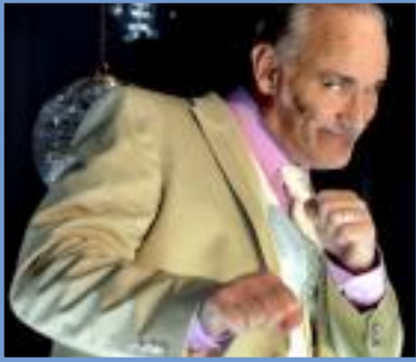
stille hunde Holzminden

...mit mehr als 190 kostenfrei gemeldeten Veranstaltungen Kostenlos