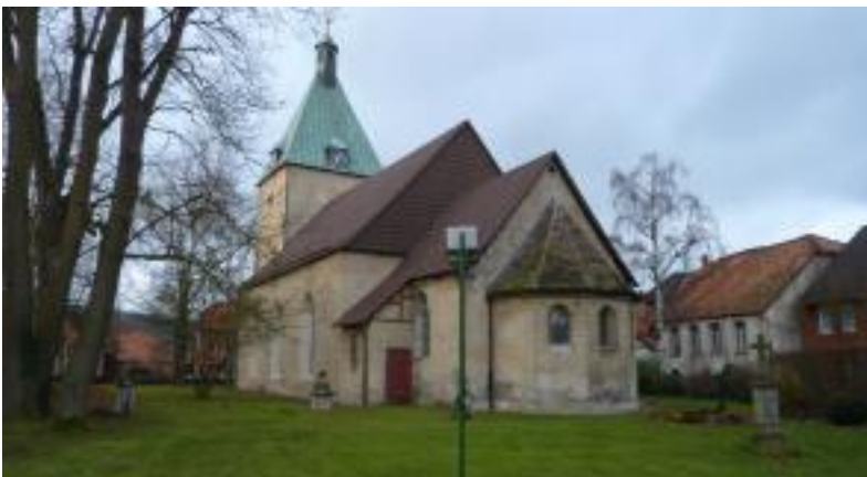
Kirche mit der von Pastor Grupen 1714 gebauten Sakristei