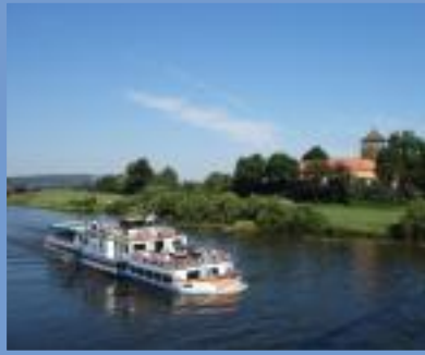
Flotte Weser Hameln