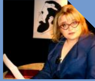
dolce vita Lauenförde