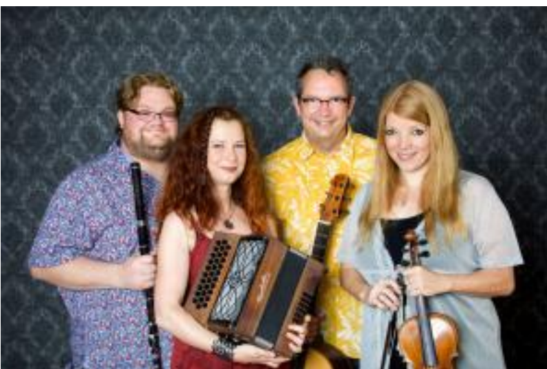
Deutsch - Trad Folk, made in Germany

(Text & Foto: Stadt Uslar Touristik-Information, Claudia Filpe)