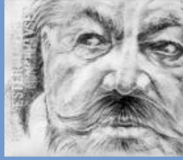
d platziert Bevern