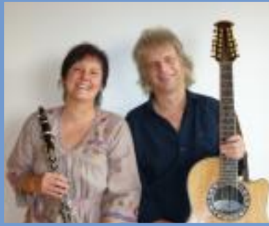
Nordic Sunset Lüerdissen