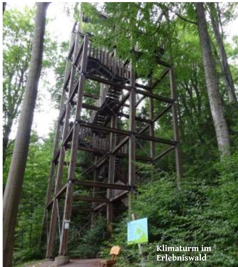
Klimaturm im Erlebniswald