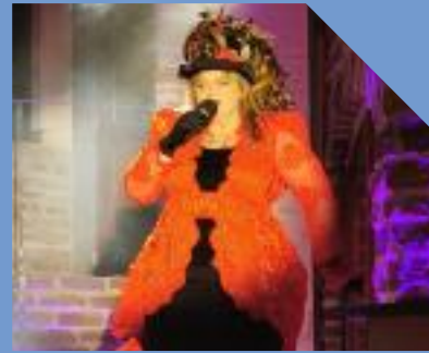
dolce vita Lauenförde