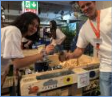
Grünes Labor Hameln

...mit mehr als 80 kostenfrei gemeldeten Veranstaltungen Kostenlos