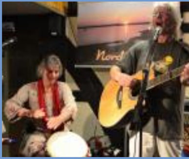
Nordic Sunset Lüerdissen