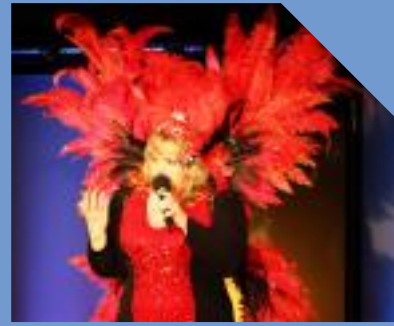
dolce vita Lauenförde