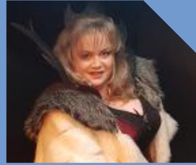
dolce vita Lauenförde