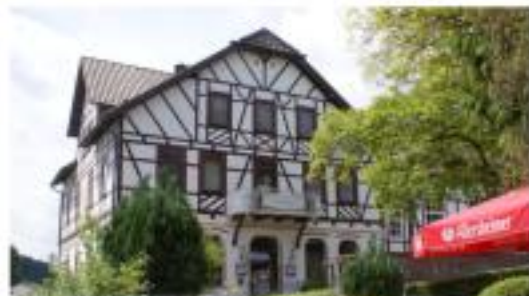
Tanz in den Mai in unserem Berggarten und Maibaum-Aufstellen der Hellentaler Feuerwehr am 30.04.2014

Internet: www.loenskrug-hellental.de | e-Mail: kontakt@loenskrug-hellental.de